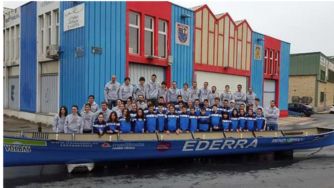
Lutxana Arraun Elkarte