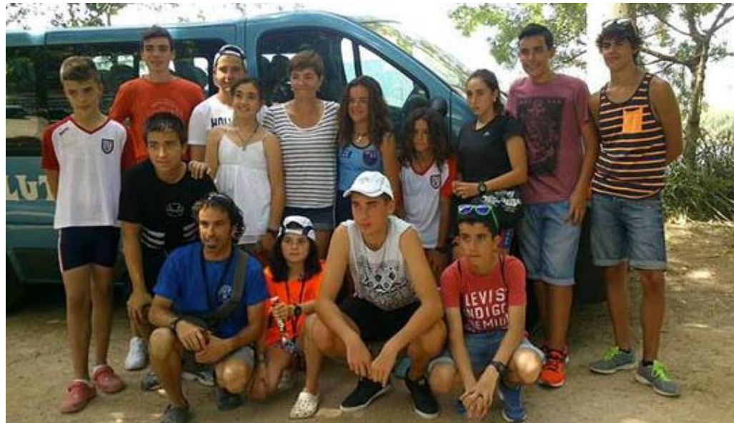
Lutxana Arraun Elkarte